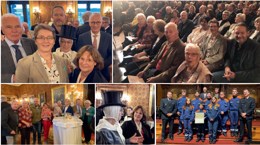
Mitglieder des Bürgervereins mit Bürgermeister Tschentscher, der „Butterfrau“ und einigen ausgezeichneten Jungfeuerwehrfrauen und -männern beim Bürgertag im Hamburger Rathaus.