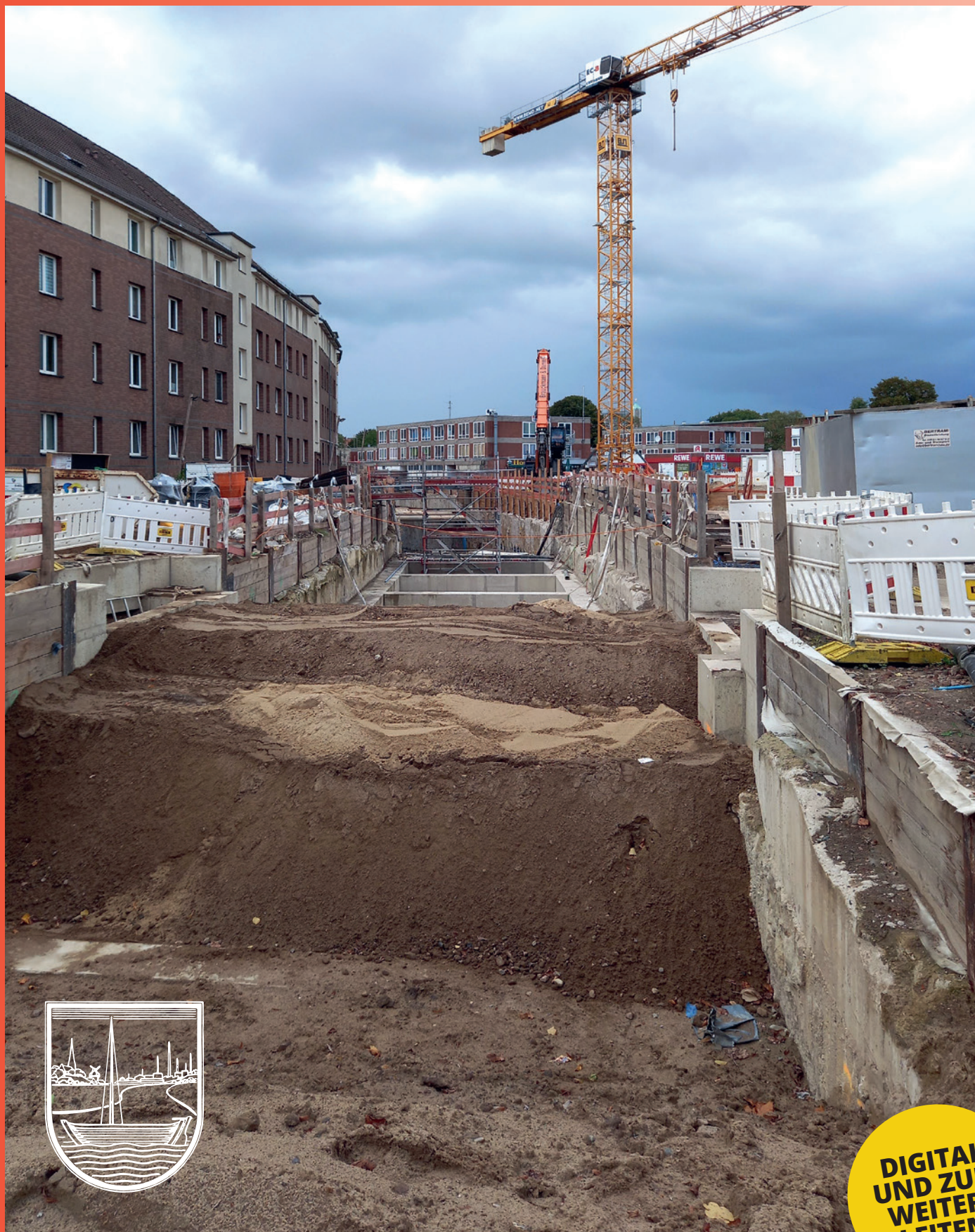
Die Bauschneise der U4 in der Nähe des Meurerwegs (Rolf Sander)

Zeitschrift des Bürger- und Kommunalvereins Billstedt von 1904 e.V.