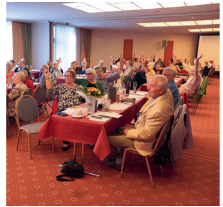
Bei gelöster Stimmung wurden die meisten Entscheidungen schnell getroffen